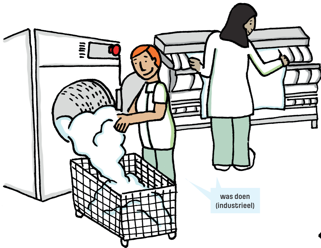
was doen (industrieel)