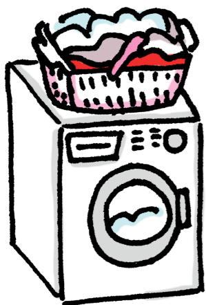
was doen en strijken bij een oudere thuis