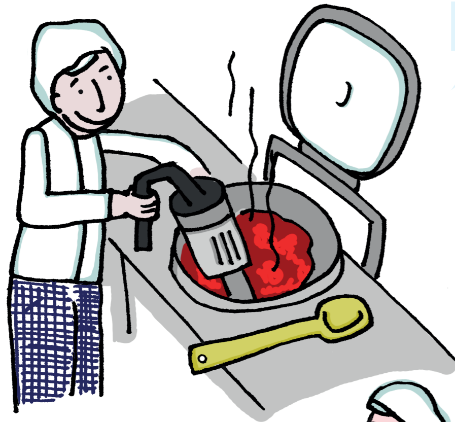
soep mixen in een grootkeuken