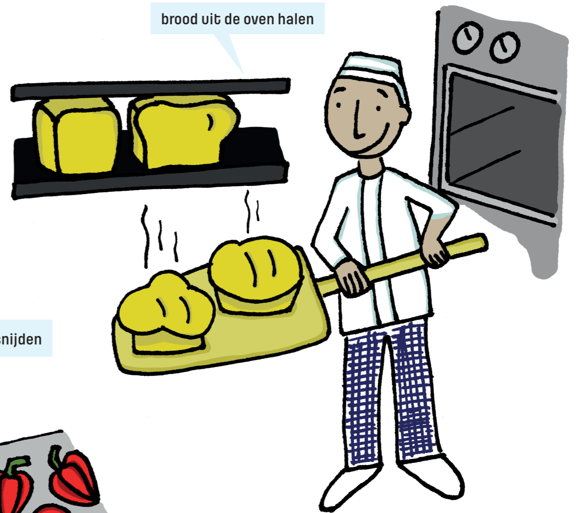
brood uit de oven halen