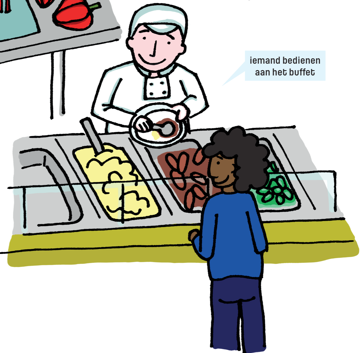
iemand bedienen aan het buffet